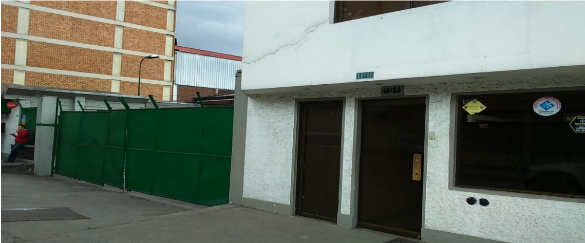
Foto 1. Fachada de la antigua planta de SIGRA S.A.

Finalmente, es importante resaltar que aunque el número del expediente reposa en la base de datos del grupo de aguas subterráneas no se encuentra en Forest ni en físico, por tanto no pudo revisarse los antecedentes de este pozo.