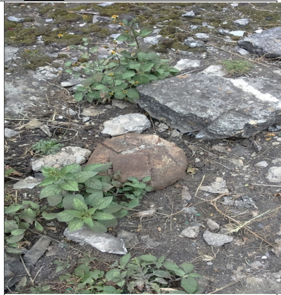
Foto 4. Vista de la boca del pozo pz-09-0016 sellada definitivamente