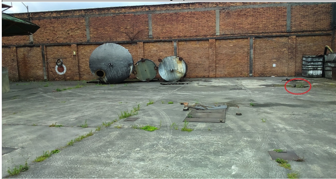
Foto 2. Sitio de la antigua planta donde funcionaba el pozo pz-09-0016