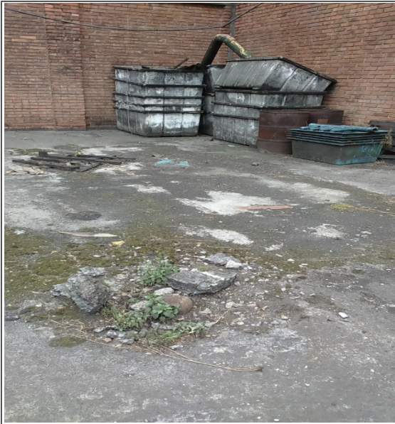
Foto 3. Acercamiento a la zona donde se ubicaba el pozo pz-09-0016